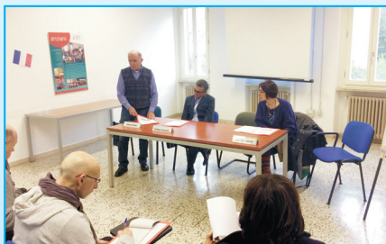
Conferenza stampa, progetto Don Dario