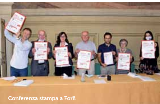
Conferenza stampa a Forlì

È stata presentata martedì 14 settembre a Forlì e giovedì 16 settembre a Cesenatico la 21a edizione della Lotteria della Solidarietà , un evento di raccolta fondi, ideato tanti anni fa da don Dario Ciani, che oggi rappresenta una preziosa occasione per l'autofinanziamento del comparto del Non Profit locale. L'iniziativa, promossa congiuntamente dalla nostra associazione, dal Consorzio Solidarietà Sociale di Forlì e da VolontaRomagna ODV , è sostenuta dalla Fondazione Cassa dei Risparmi