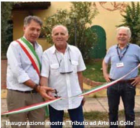
Inaugurazione mostra "Tributo ad Arte sul Colle"