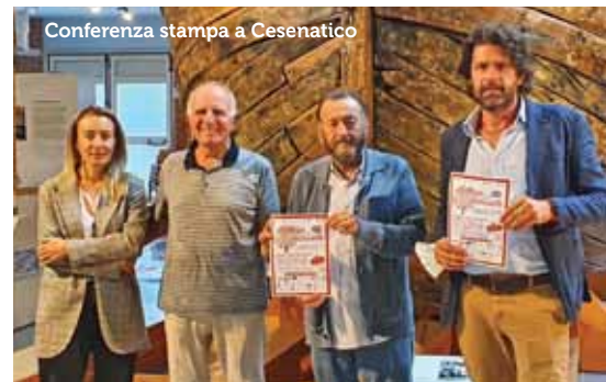
Conferenza stampa a Cesenatico

Il 1° premio è un Buono Vacanze da euro 1500 spendibile presso uno dei 20 Villaggi Club del Sole, il 2° e il 3° sono Buoni Acquisto da euro 600 e euro 300 presso il Centro Radio TV Casadei-Expert di Forlì. La principale novità della Lotteria della Solidarietà 2021/2022 è l' espansione territoriale al territorio cesenate , grazie