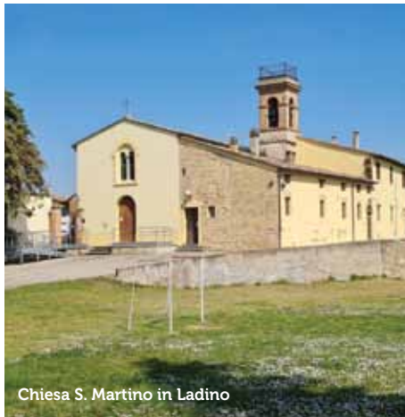
Chiesa S. Martino in Ladino