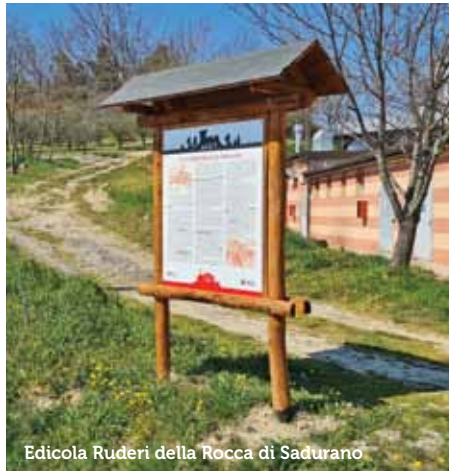
Edicola Ruderi della Rocca di Sadurano