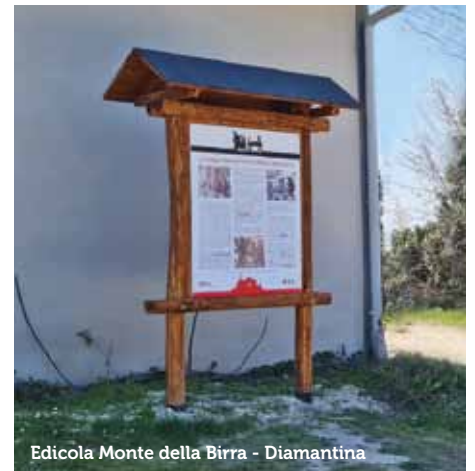
Edicola Monte della Birra - Diamantina

coperto da fitti boschi, al confine tra lo Stato Pontificio ed il Granducato di Toscana.