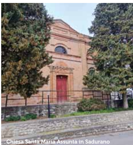
Chiesa Santa Maria Assunta in Sadurano